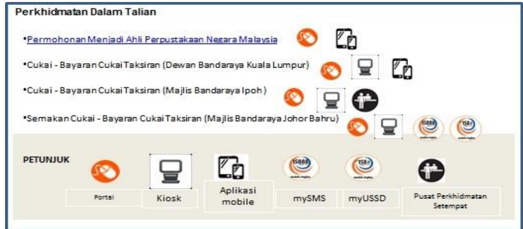
Rajah 4: Ikon Perkhidmatan Pelbagai Saluran